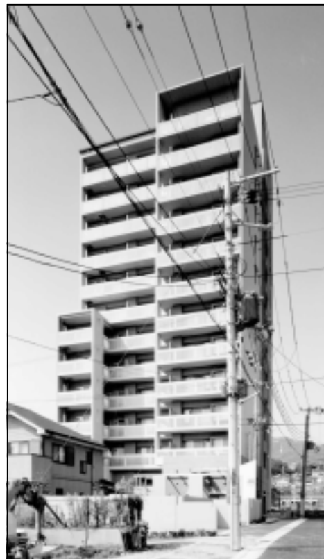
南東外観 - 電線埋設化が望まれる。

空地を生み出し、インナー型市街地総合設計制度を適用して、容積率割増及び(西側)斜線制限の緩和を受けています。