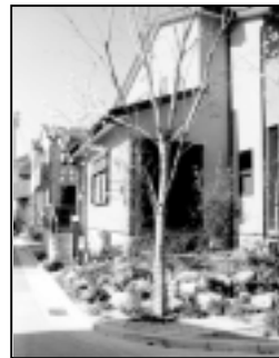
ふれあいを生む街角