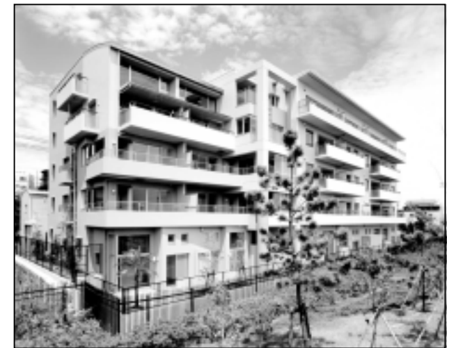
南西外観 - 前面南に舞子公園が広がる。

プロジェクトデータ 名称: コージースクエア垂水海岸通 所在地: 神戸市垂水区海岸通1921-3 敷地面積: 1,239.00㎡ 延床面積: 2,682.52㎡ PPI担当: 三好、内田、桑原、田中、淡路