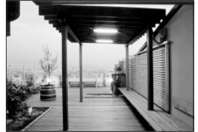
屋上庭園 - 前方に大阪湾が見渡せる。

プロジェクトデータ 名称: グランドーレ大道 所在地: 神戸市長田区大道通5丁目1番 敷地面積: 728.71㎡ 延床面積: 2,758.28㎡ PPI担当: 三好、内田、田中、淡路